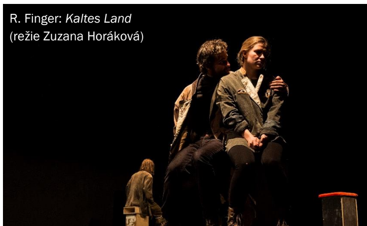
R. Finger: Kaltes Land (režie Zuzana Horáková)